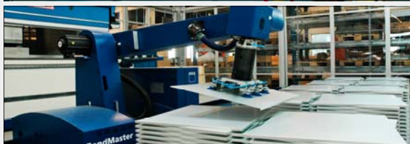
Robot-knekking - Høy effektivitet og presisjon