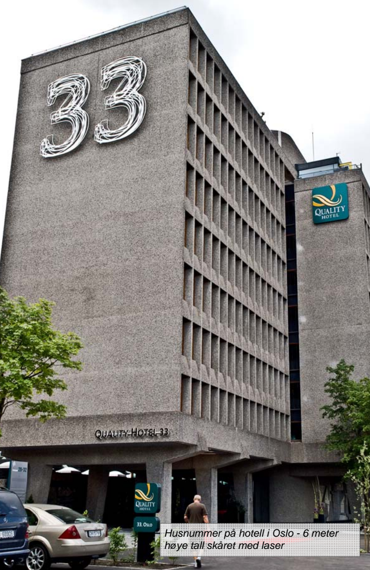
Husnummer på hotell i Oslo - 6 meter høye tall skåret med laser