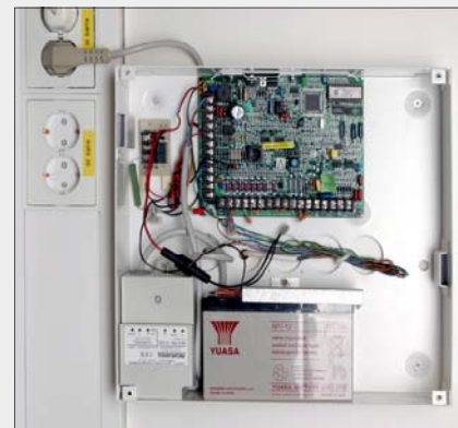
Skap for Elektro/Data/Alarm/ Lås-systemer etc.