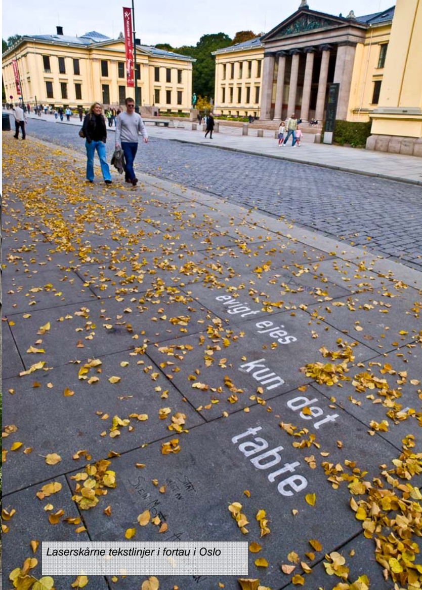
Laserskårne tekstlinjer i fortau i Oslo