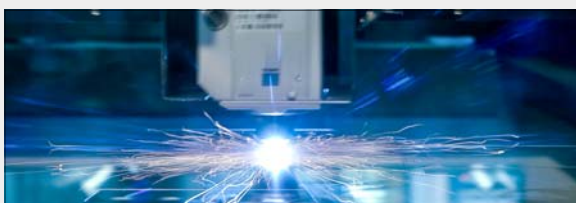
Laserskjæring - Høy presisjon og kvalitet