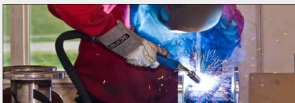
Sveising, klipping, gjenging, sliping, valsing, montering, lakkering og overflatebehandling. Pakking og evt. distribusjon etter avtale.