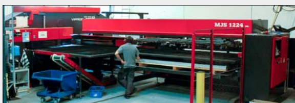
Stansing og nibling - Fullautomatisert