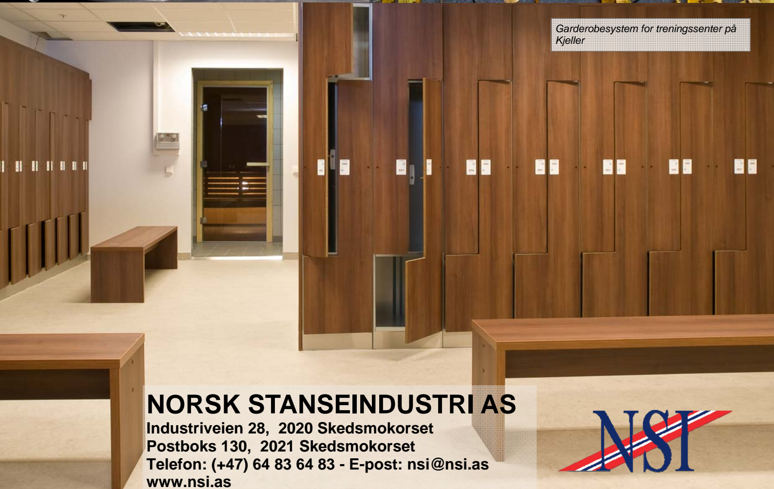
Garderobesystem for treningssenter på Kjeller

NORSK STANSEINDUSTRI AS Industriveien 28, 2020 Skedsmokorset Postboks 130, 2021 Skedsmokorset Telefon: (+47) 64 83 64 83 - E-post: nsi@nsi.as www.nsi.as